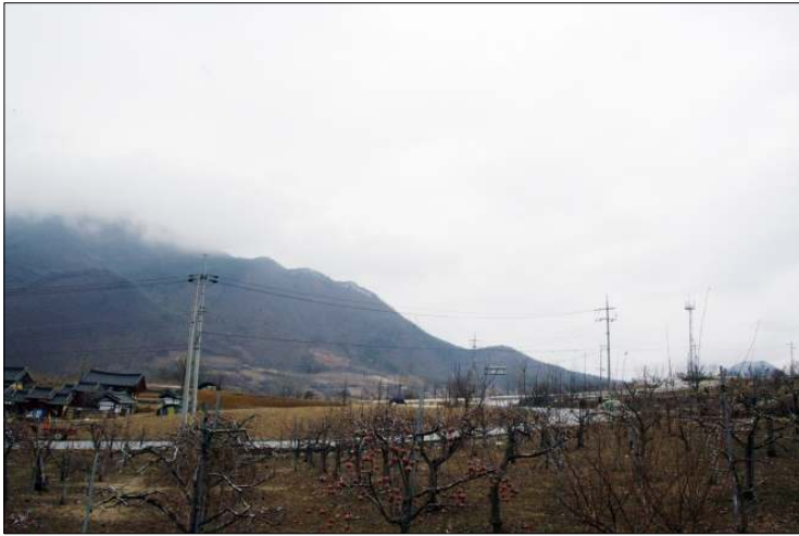
그림 5 3차 이진된 현 영춘향교 윗편의 향교터