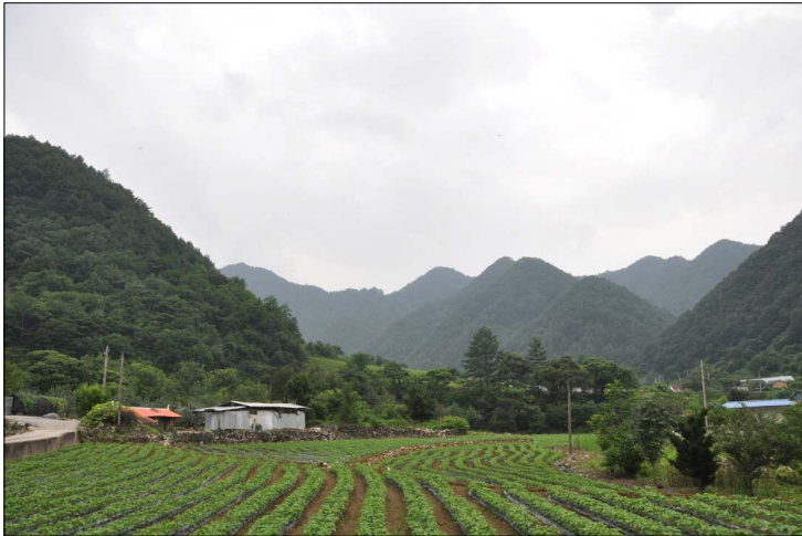
그림 2 1차 이진 위치인 남천 2리 대어구 전경