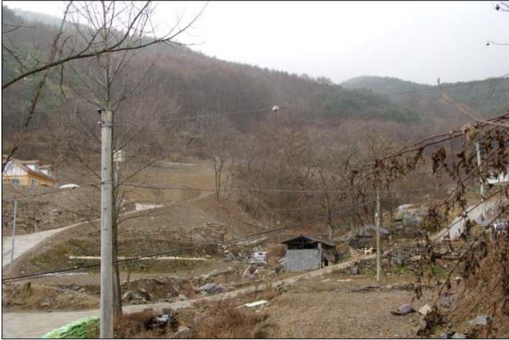
그림 4 2차 이건 위치인 오사리 화산골 전경