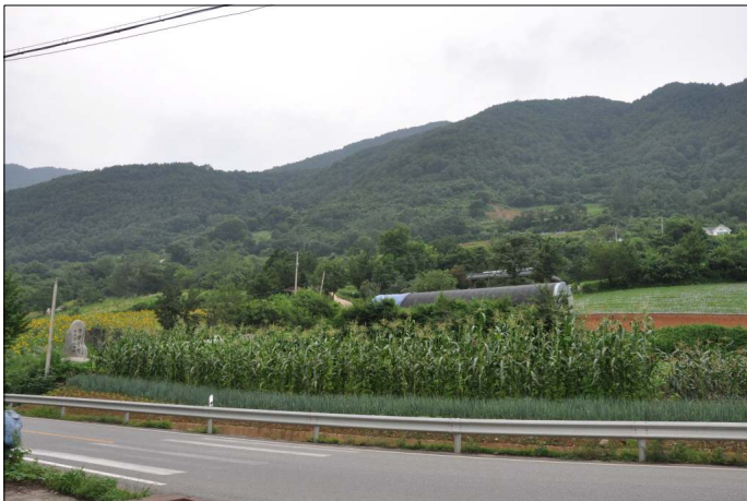
그림 1 창건위치(태화산 아래, 상 2리 느티마을)

그렇다면 창건 당시 영춘향교의 위치는 어디였을까? 현재 영춘향교는 영춘면 상리 461번지에 위치한다. 그러나 영춘향교는 조선 초기 최초의 창건 위치에서 이후 이건이 이루어졌음이 확인되기 때문에 원래의 위치는 따로 있다. 영춘향교 위치에 대한 최초 관찬기록인 『신증동국여지승람(新增東國輿地勝覽)』(1530년 발간) 영춘현 향교조에는 향교의 위치가 ‘재현 북이리(在縣北二里)’라고 기록되어 있다. 또한 영춘향교에서도 영춘현 치소에서 북쪽으로 약 2.5리 떨어져 있는 상 2리 느티마을을 창건위치로 전하고 있으므로 느티마을이 최초의 창건장소였을 것으로 추정된다.