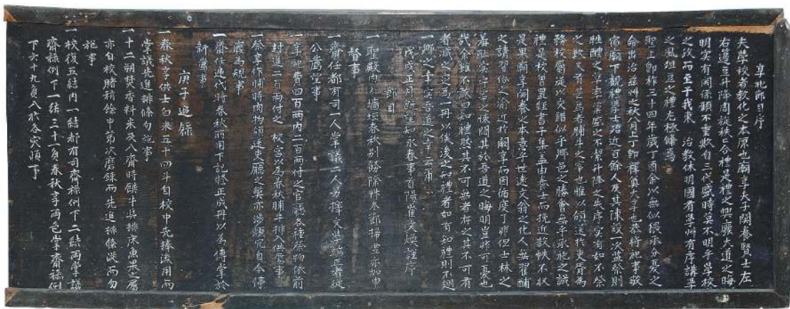
그림 6 「향사절목서(享祀節目序)」 현판

이다. 이로 인하여 영춘향교는 일신의 계기를 마련한다. 이중 문제점으로 지적된 아전에게 소고기를 아전에게 보내는 일은 1862년에 아전들이 영춘향교 계금을 만들어 주었기 때문으로 추정된다.