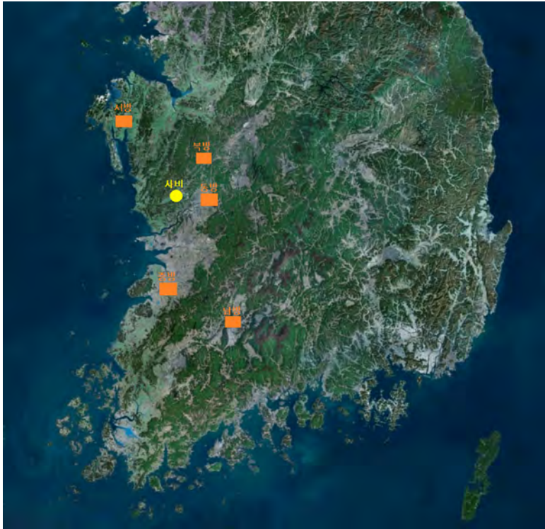
<그림 2> 사비도성과 五方の 위치

<그림 2>에서 볼 수 있는 바와 같이 각 方은 사비도성을 중심으로 방사상의 형태로 배치되어 있음을 알 수 있다. 특히 西方-北方-東方으로 이어지는 方의 위치는 사비도성을 에워싸고 방어하는 역할을 하였을 것임을 짐작할 수 있다. 더불어 中方과 南方은 도성의 남부 지역과의 연계와 각각 서부와 동부 지역에 대한 방어의 중심지 역할을 하였을 가능성을 보여준다.