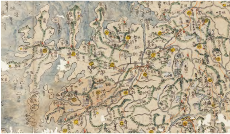
<그림 1> 東域圖 경기·충청도 일부

이는 앞서 언급하였던 北方과 中方·東方의 경우와 유사한 측면을 보이고 있다. 서산의 경우 웅진 천도 이후 한강 유역을 통한 對중국 교통로가 기능을 상실하게 되면서 보다 더 부각되었을 것으로 보인다. 西方 역시 교통로 상에 위치함과 동시에 해안에서 내륙으로 진출하는 길목을 방어하는 역할을 하였을 것으로 볼 수 있다. 44)