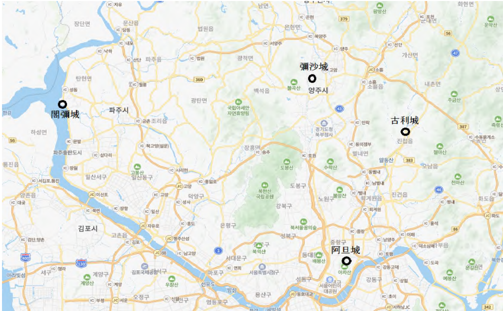
[그림 1] 閻彌城·彌沙城·古利城·阿旦城의 위치

고대에 널리 쓰인 지명어미가 바로 伐, 夫里, 火 등이다. 이들 글자는 牟羅(牟盧)와 마찬가지로 모두 들(들판), 벌(벌판)에 위치한 취락 또는 읍락 등의 거주지 단위를 가리키는 표현이다. 그런데 별로 쓰인 지명어미를 한문으로 ‘~平(坪)’으로 표기하는 사례를 다수 발견할 수 있다. 27) 일반적으로 ‘平’이나 ‘坪’字는 평지나 산간 계곡의 구분 없이 평탄한 지형을 나타내는 지명으로 가장 많이 사용되고 있으며, 특히 농경지의 평탄지는 주로 ‘平’자를 쓰고, 평탄지에 위치하는 주거지의 경우는 보통 ‘坪’자를 많이 사용한다고 한다. 28) 이상에서 살핀 것처럼 牟羅(牟盧), 伐, 夫里, 平(坪) 등이 들, 벌에 위치한 거주지 단위로 널리 사용되었음을 염두에 둔다면, 58성 가운데 臼模盧城, 各模盧城, 牟盧城 역시 넓은 들, 벌에 위치한 취락 또는 읍락의 명칭이라고 이해하여도 異見이 없을 것이다. 벌을 漢字 平(坪)으로 표기하는 것이 가능하다면, 牟羅 또는 牟盧(模盧) 역시 한자 平(坪)으로 표기하는 것이 가능하다고 볼 수 있다.