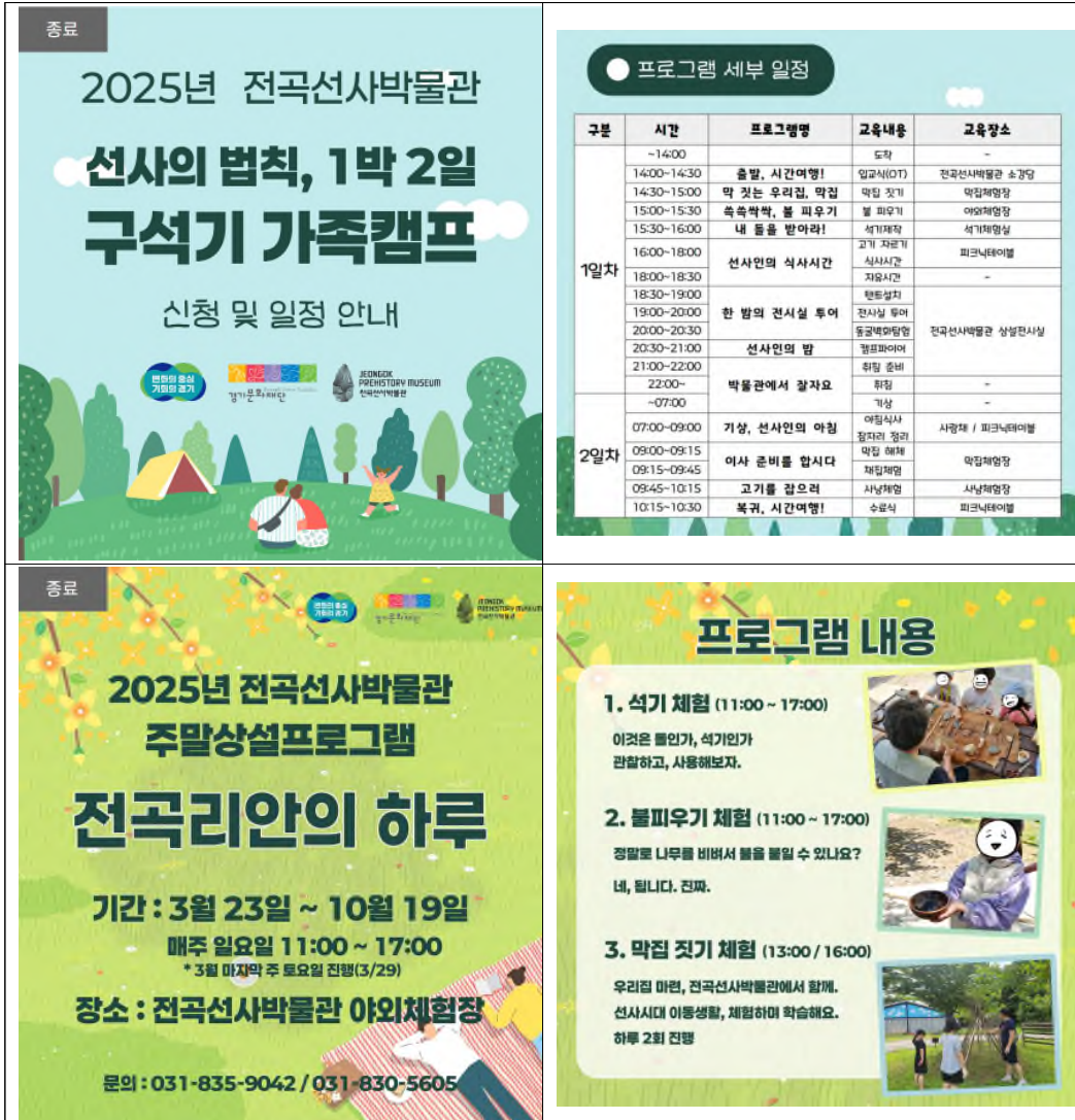
[그림 2] 전곡선사박물관 체험프로그램 사례

서울생활사박물관이 생활사 자원을 공감 가능한 서사로 전환하여 시민들의 접근성을 높였다면, 전곡선사박물관은 선사고고학이라는 비교적 난해한 주제를 체험형·참여형 프로그램으로 풀어내며 지역 밀착형 운영 모델을 제시한 사례로 주목된다. 전곡선사박물관은 가족 단위 관람객을 대상으로 ‘1박2일 구석기 가족캠프’나 ‘전곡리안의 하루’ 등과 같은 교육 프로그램을 운영하여, 관람이 전시실 체험에 그치지 않고 박물관에서 ‘하룻밤을 보내며’ 선사시대 생활상을 체험하는 방식으로 확장되도록 설계하고 있다. 이러한 캠프형 프로그램은 단순한 야외 숙박이 아니라 박물관 교육의 맥락 속에서 일정과 체험 활동이 구성되는 방식