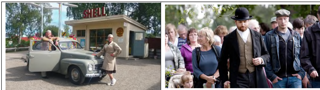
[그림 3] 얀틀리 역사랜드 프로그램

여름 시즌에 운영되는 ‘얀틀리 역사랜드(Jamtli Historyland)’ 22) 에서는 얀틀리 일대의 집과 농장들을 배경으로 18세기, 19세기, 20세기의 특정한 복식과 언어, 생활양식을 구현한 해설자(주민·배우 등)와의 상호작용 속에서 관람객이 노동과 놀이, 일상 과업에 직접 참여하도록 설계된다. 이 과정에서 관람객, 특히 아동 및 청소년은 과거를 보는 수준을 넘어 과거를 수행하는 경험을 통해 지역의 역사를 자신의 경험으로 내면화하게 된다. 얀틀리 박물관 사례는 정적인 유물 전시가 주를 이루고, 교육이 전통놀이·공예 체험에 수렴하기 쉬운 공립박물관 현실에서 역할 수행형 체험(리빙 히스토리) 또한 지역의 역사 자원을 생동감 있는 교육 콘텐츠로 전환하는 실질적 대안이 될 수 있음을 보여준다.